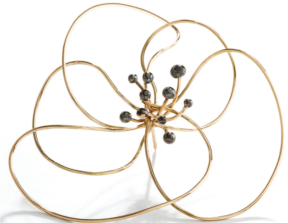
BROCHE Gul Blomst Hvor Kuglerne Faldt. Guld og sorte perler.