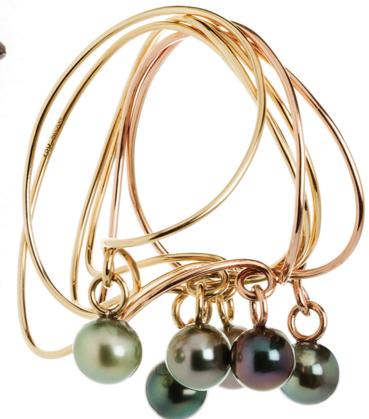
ARRRING I stedet for skud kunne man jo sætte samtale... Her er det armringsen Diskussion. Guld og perler.